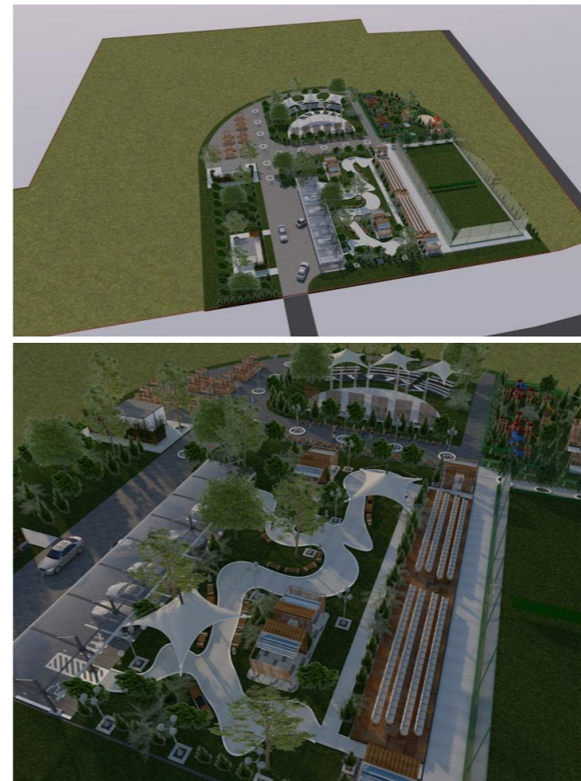
▼ SUGESTIE DE MOBILARE